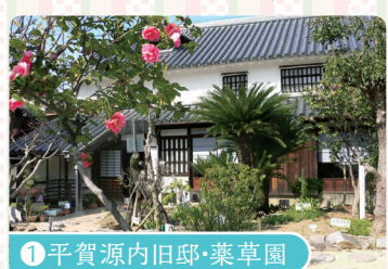
① 平賀源内旧邸・薬草園