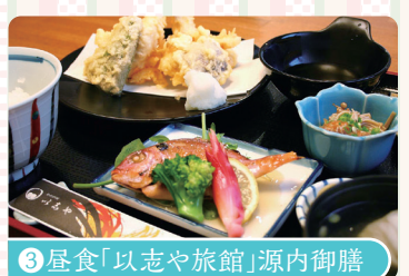
③ 昼食「以志や旅館」源内御膳

源内の多彩な業績を展示する記念館を見学し、その足跡をたどります。エレキテルも実際にご覧いただけます。