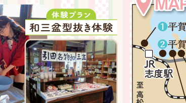
体験プラン 和盆型抜き体験

東かがわ市の地場産業のほか、地域の歴史・民俗に関する資料が展示された資料館。砂糖づくりに必要な道具などを見ることができます。