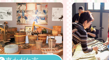
⑥ 東かがわ市歴史民俗資料館

和盆になる手前の白下糖づくりは、かつてさぬき市津田地区で行なわれていました。時代が変わっていく中、伝統を守るために製法を受け継いだ職人さんのお話を伺いし作業工程の説明を受けながら、工場見学をします。※実際の作業は冬季シーズンに行う為、ツアー当日の作業見学はございません。