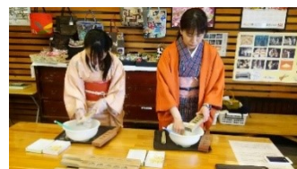
▲和三盆型抜き体験

四国に存在する地域資源・文化資源を掘り起こし、地域と協働して付加価値付けされた観光素材・文化素材に磨き上げ、観光による地域活性化を目指す取り組みです。