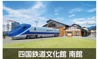
四国鉄道文化館 南館