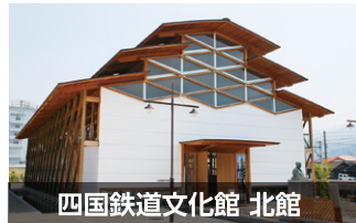
四国鉄道文化館 北館

「鉄道歴史パーク in SAIJO」は、JR伊予西条駅の東隣に位置し、エリア内には、「四国鉄道文化館 北館」「四国鉄道文化館 南館」「十河信二記念館」「観光交流センター」の4施設があります。