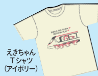
えきちゃんTシャツ(アイポリ)

鳴門金時芋を使ったスイーツや、徳島ならではの和菓子、軽食、アルコール、ソフトドリンクのほか、最新えきちゃんぐグッズも!