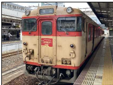
ノスタルジー車両（キハ47形2両）全席指定席