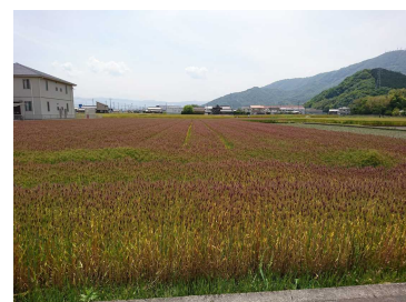
▲ラベンダーカラーに色づく麦畑