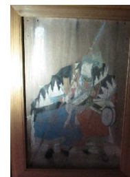
椿泊 佐田神社の絵馬

四国に眠る地域資源・文化資源を掘り起こし、地域と協働した魅力的な観光素材・付加価値の高い文化素材に磨き上げ「四国家のお宝」としてプロモーションする取り組みです。