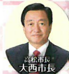
高松市長 大西市長

高松市は、北は多島美を誇る海の国立公園、瀬戸内海に面し、南は讃岐山脈を臨む、風光明媚で温暖な瀬戸の都です。高松港からフェリーで約20分に位置する女木島は、別名「鬼ヶ島」と呼ばれ、鬼の伝説が伝わる鬼ヶ島大洞窟や瀬戸内海を360度見渡せる展望台等、島ならではの見どころが満載です。ゆったりとした島時間をお楽しみください。