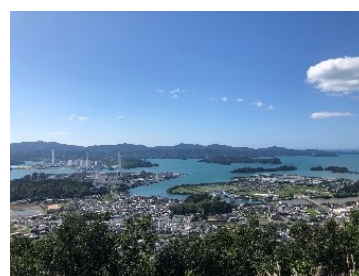
椿泊・橋湾の景観