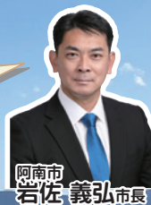
阿南市 若佐 義弘 市長

四国最東端に位置する阿南市は、海・山・川の自然に恵まれ、若杉山遺跡や阿波水軍などの由緒ある史跡と四国遍路のお接待文化が息づく一方で、LEDの世界的シェアを誇る地場企業があるなど、豊かな自然と文化、産業が鮮やかに調和したまちです。