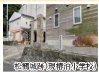
松鶴城跡(現椿泊小学校)