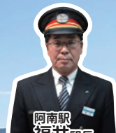
阿南駅 福井 駅長