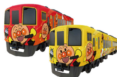
土讃線あかい・きいろいアンパンマン列車