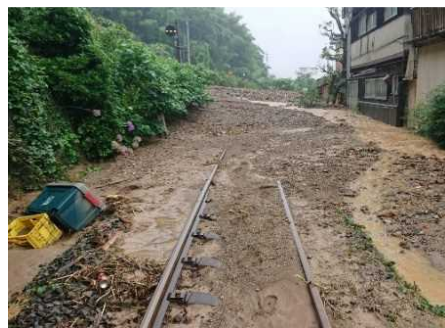
⑨予讃線 千丈・八幡浜