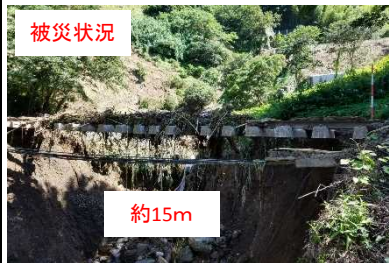
①下宇和・立間間283k280m 盛土崩壊