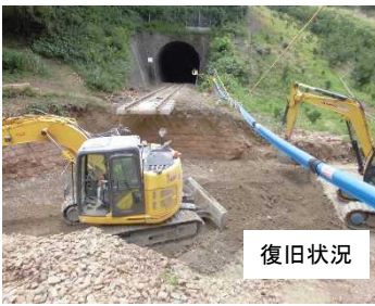
②下宇和・立間間283k990m 斜面崩壊