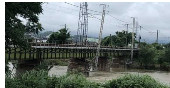
①予讃線 本山・観音寺

【卯之町・宇和島の復旧予定】 運転再開9月13日予定 (天候により変更になる可能性があります) バス代行:実施中