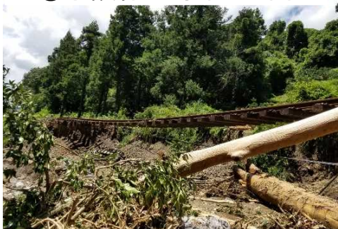
⑩予讃線 下宇和・立間