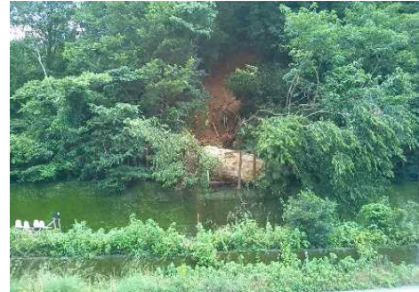
⑥予讃線 伊予出石・伊予白滝