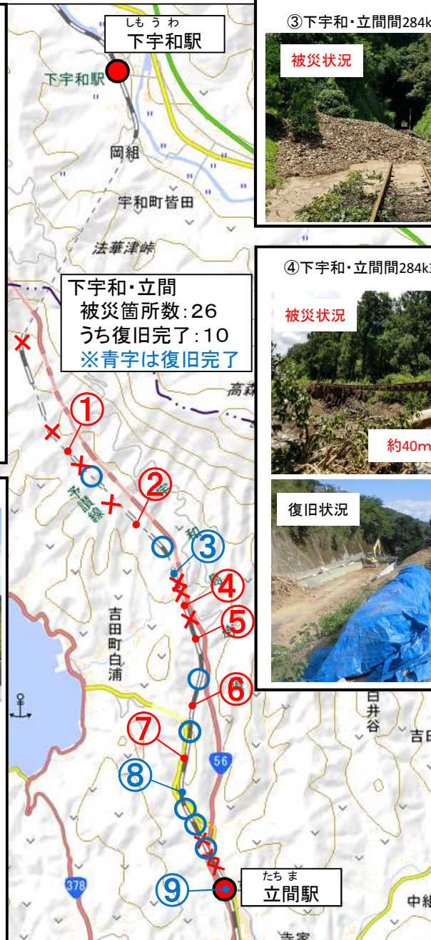
③下宇和・立間間284k165m 土砂流入