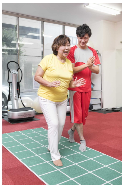
スクエアステップを用いた歩行訓練