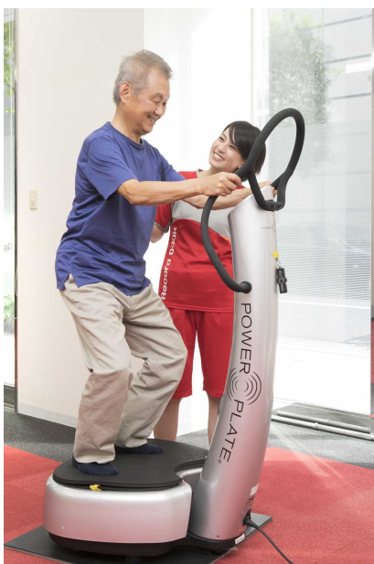
高機能マシンを用いた筋力トレーニング