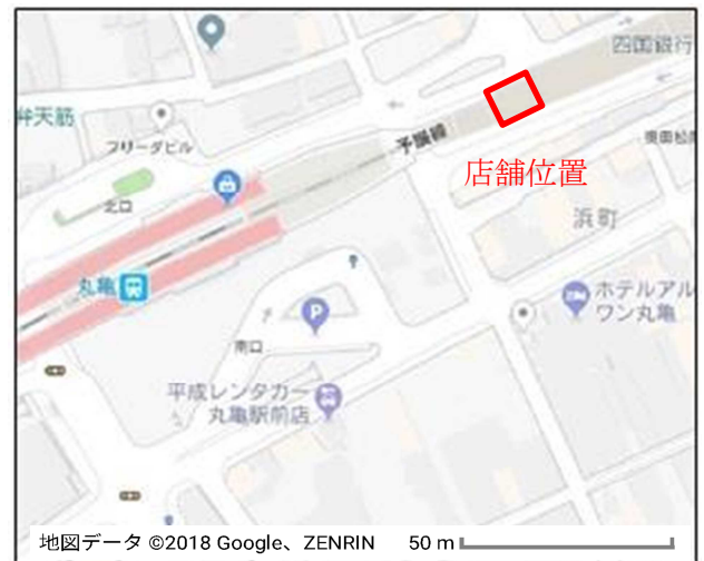
J R 四国レコードブック丸亀駅前