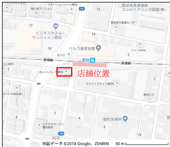
J R 四国レコードブック栗林駅前