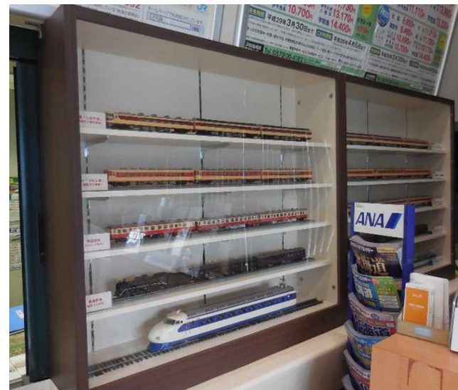
宇和島駅きっぷ売り場横