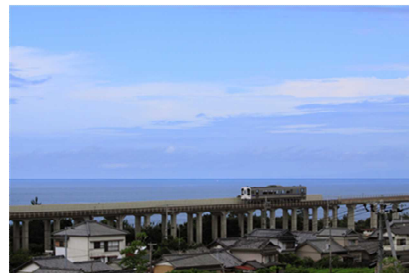
ごめん・なはり線運転区間（イメージ）