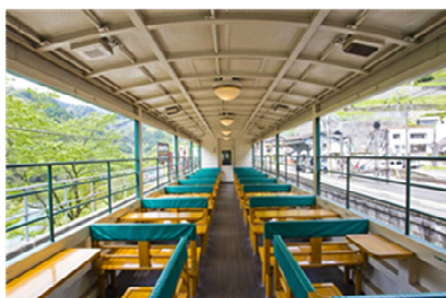
トロッコ列車車内