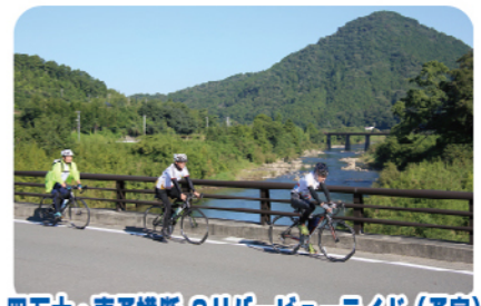
四万十・南予横断 2リバービューライド(予定)

全国の模型・ホビー・フィギュア愛好家の聖地。 童心に帰り、四万十の自然に触れる、癒しの施設。