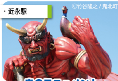
鬼のモニュメント

宇和島藩第七代藩主伊達宗紀(むねただ)が、隠居の場所として建造した庭園。 4月の藤、6月の花菖蒲が見える。